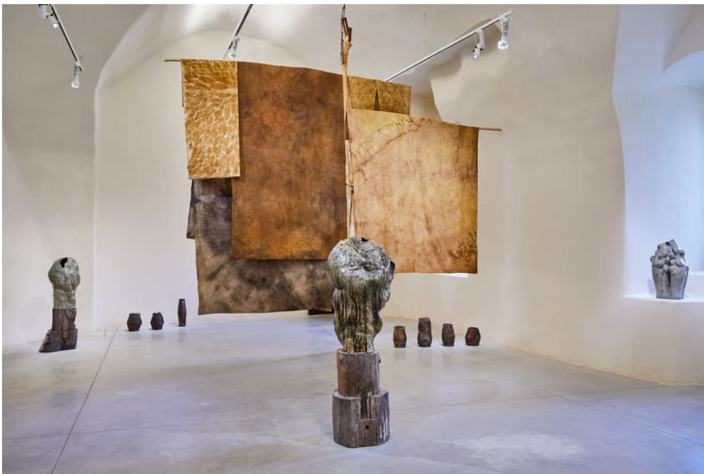
C14 PARIS 2025, Île Mer Froid , installation céramique et textile, 2024 © C14

Du 2 au 5 octobre, de 11h à 19h (sauf le 2, nocturne jusqu'à 22h et le 3, jusqu'à 18h)