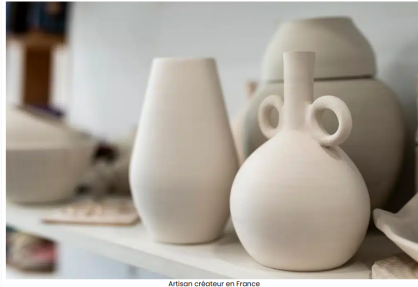
Artisan créateur en France